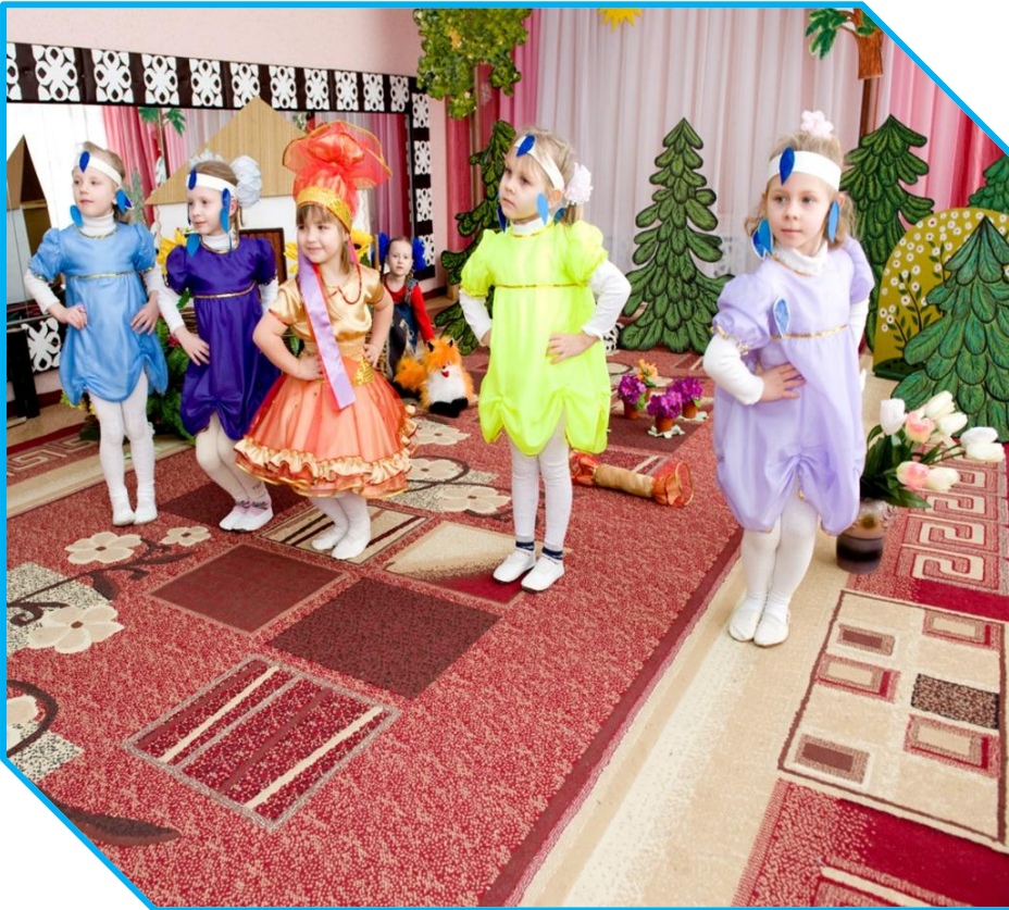
«Танок краплинок», у виконанні дітей середньої групи

Хореографічний гурток «Веселі черевички» щороку бере участь у міському фестивалі дитячої творчості «Первоцвіт», а також є дипломантом Всеукраїнського конкурсу «хай живе надія!».