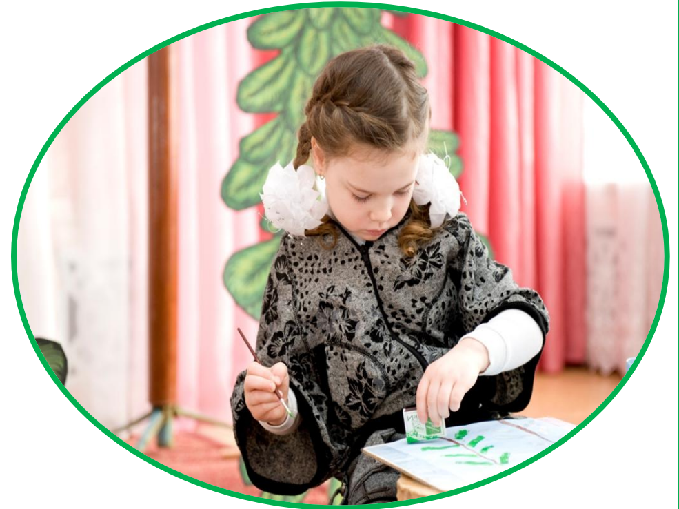
Заняття гуртка «Олівець-малювець»

Роботи гуртків «Олівець-малювець», «Умілі ручки» можна переглянути на постійно діючій виставці «Дитячий вернісаж».