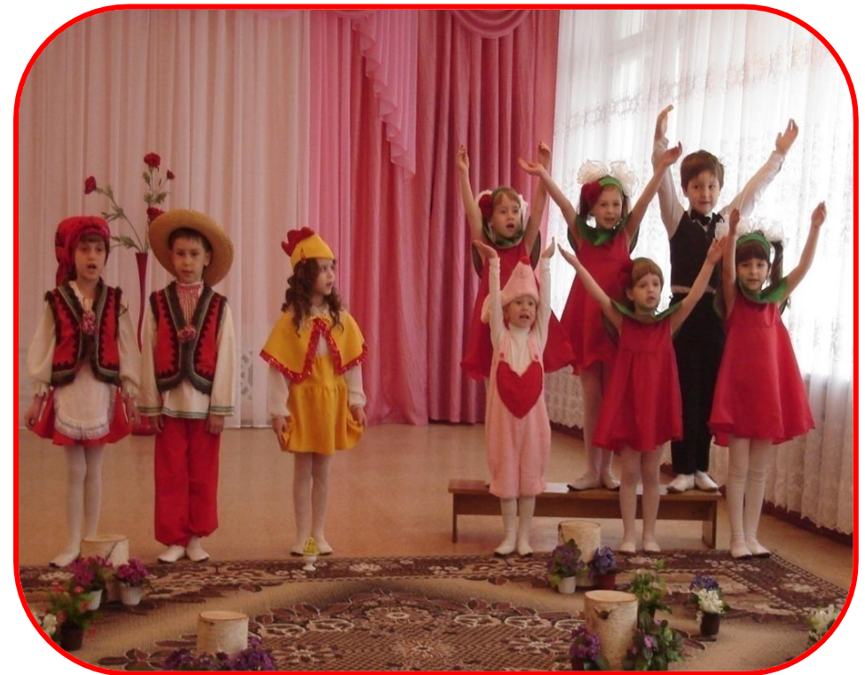
Фестиваль «Сузір'я талантів» 2008 р.

Протягом навчального року накопичується багато напрацювань різних гуртків: цікаві номери, талановиті роботи, тому ми започаткували в своєму дошкільному закладі щорічне проведення дитячого фестивалю мистецтв «Сузір'я талантів», куди запрошуємо і батьків, і вчителів, і працівників позашкільних закладів.