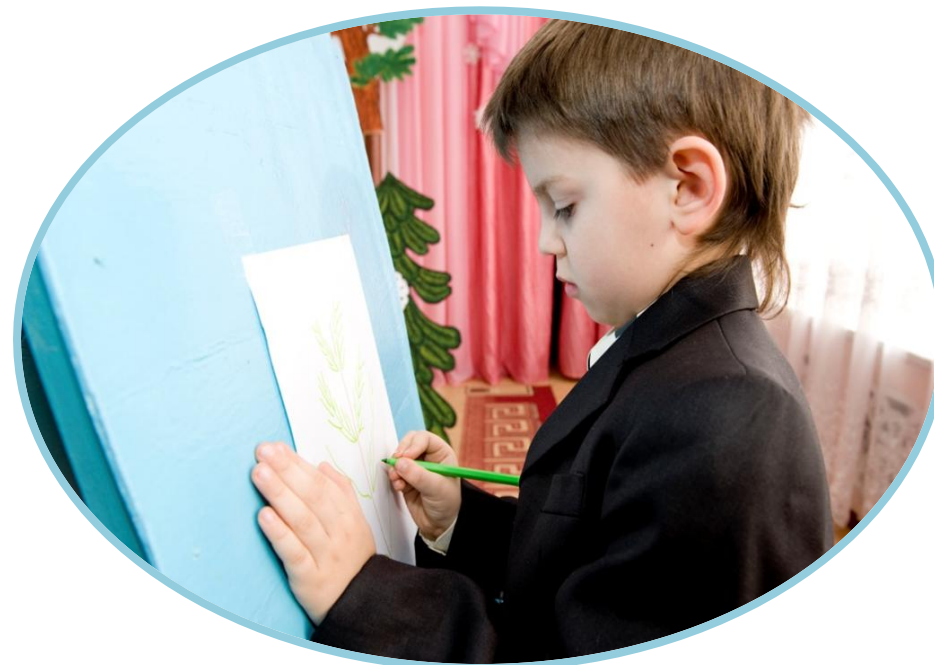
Гурток «Олівець – малювець»

Неординарний, творчий підхід до своєї справи з боку всіх працівників дошкільного закладу – запорука успіху у формуванні творчо спрямованої особистості дошкільника.